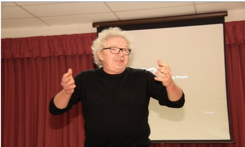
Vrijwilligersbijeenkomst in De Hunenhof in Drunen, april 2016